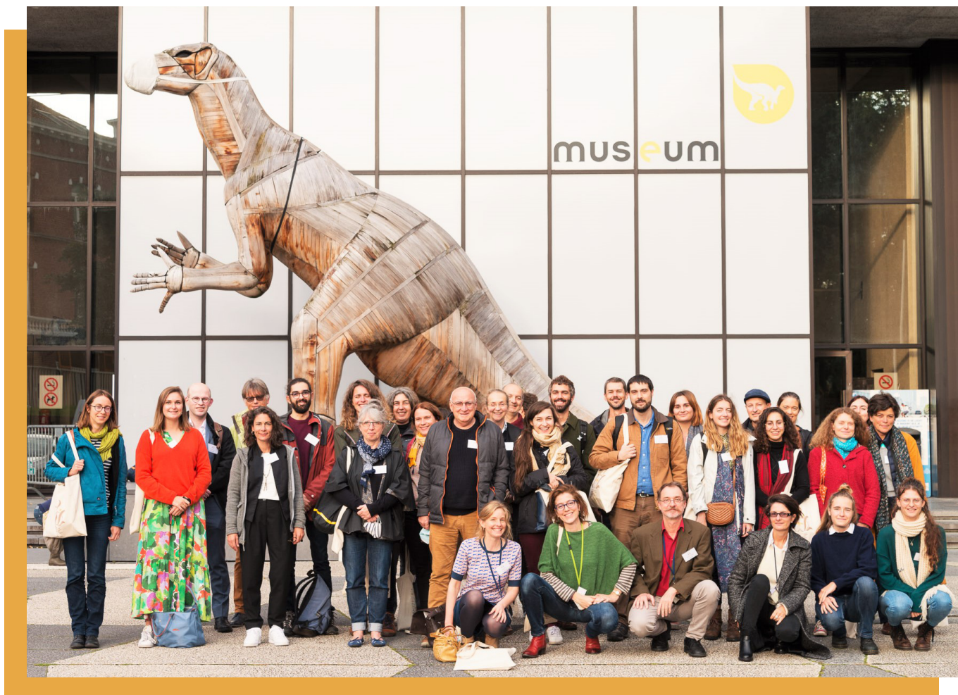
Figure 1 : Groupe des 14 e RALF de Bruxelles, Belgique (2021)